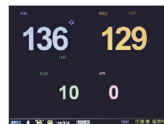
Tampilan Teks Lebar